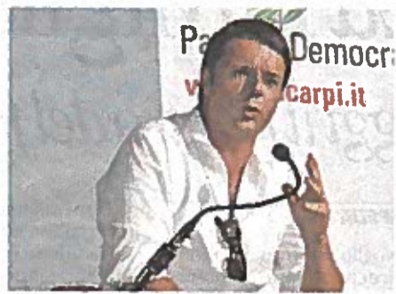
Matteo Renzi ad una festa del Pd